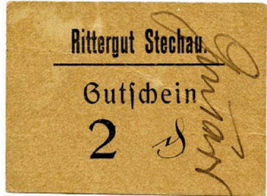
Kleiner Schein mit großer Wertsteigerung: der 2 Pfennig Gutschein des Rittergutes Stechau.

Die Händler wussten nicht mehr, woher sie Wechselgeld bekommen sollten. Hier und da konnte man anschreiben lassen oder zwei Bier mehr trinken, um eine gerade Summe zu erreichen. Doch damit war das Problem nicht gelöst. Viele Geschäftsleute gaben handschriftliche Quittungen über Restbeträge aus, die bei nächster Gelegenheit wieder eingelöst werden konnten.